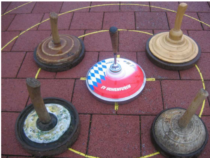
Eisstöcke aus den letzten 4 Jahrzehnten